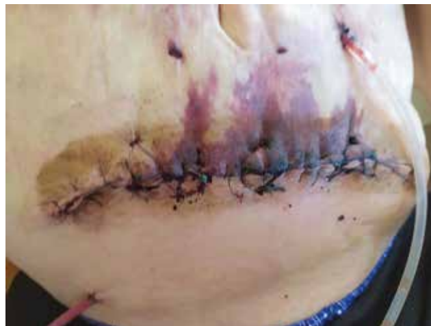
Рис. 4. Послеоперационное фото брюшной стенки пациента через 48 ч после операции