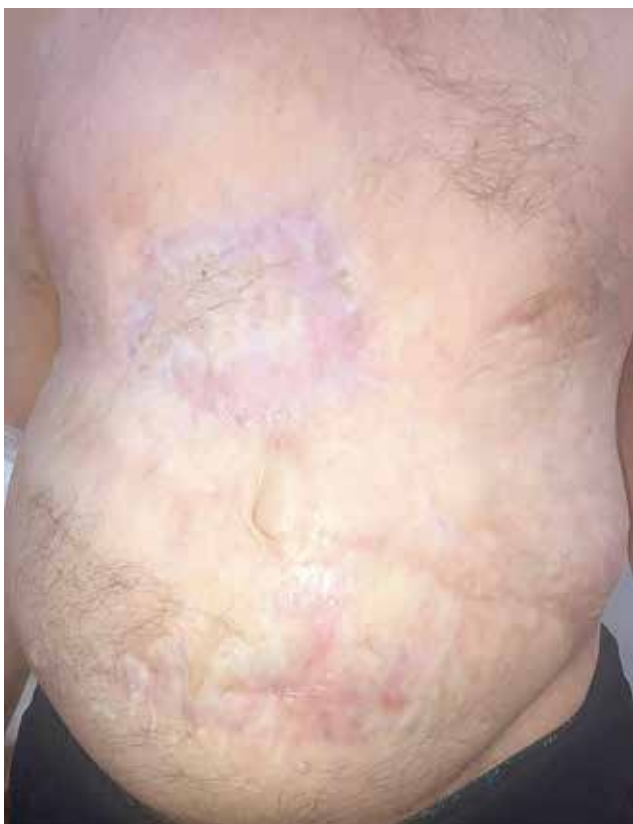
Рис. 5. Послеоперационное фото пациента через 11 мес

(C44.5) pT3N0M0, 3 стадия (UICC). Высокий риск рецидива опухоли по клиническим (размер опухоли более 20 мм, зона послеожогового рубца) и морфологическим (акантолитический тип) факторам риска. Пациент был выписан на 18-е сутки после операции. Осмотр проводился амбулаторно каждые 10 дней на протяжении первых 2 мес после операции. В результате заживление кожи под струпом на всем протяжении оперативного доступа. Пациент осмотрен через 6