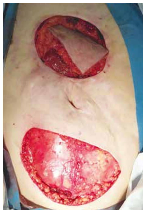
Рис. 2. Интраоперационное фото. TRAM-лоскут перемещен в дефект грудной стенки

Рана грудной стенки дренирована перфорированной силиконовой трубкой. Дренаж выведен в левом подреберье, подсоединен к вакуумной аспирации по Редону. Наложены нерассасывающиеся узловы швы, фиксирующие край трансплантата к краю рубцовой измененной кожи грудной стенки. С целью укрепления передней брюшной стенки выполнена ненатяжная пластика ее полипропиленовым сетчатым имплантатом. Имплантат вшит между краями переднего лист-