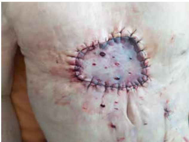
Рис. 3. Послеоперационное фото грудной стенки пациента через 24 ч после операции